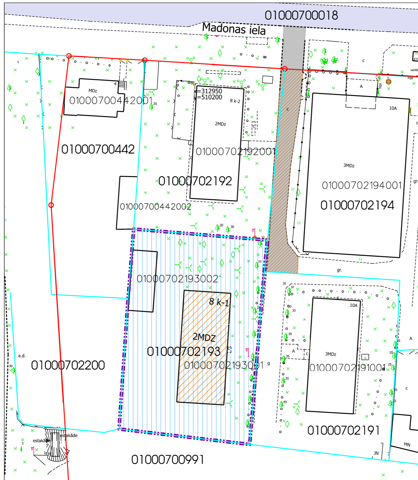
Daudzdzīvokļu dzīvojamai mājai funkcionāli nepieciešamā zemesgabala novietojums